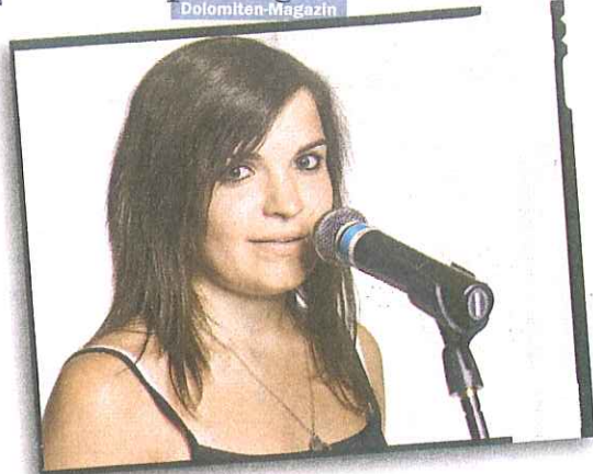
„Chance 2.0“ richtet sich an Schülerinnen und Schüler sowie an Studentinnen und Studenten (mit Hauptwohnsitz in Südtirol) aller drei Sprachgruppen im Alter zwischen 16 und 21 Jahren.