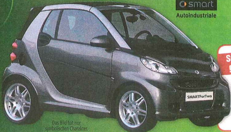
Das Bild hat nur symbolischen Charakter.