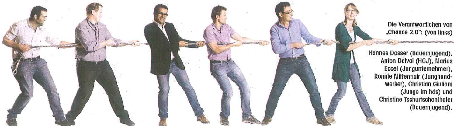
Die Verantwortlichen von „Chance 2.0“: (von links)

...UND ORGANISIEREN FÜR EUCH DIE BESTEN PRAKTIKA FÜR DEN SOMMER